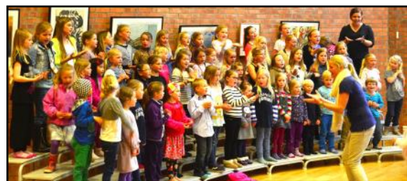
RaBa-koret i Randesund: Mer enn 1500 sangere over 17 år.

I 17 år har Rabakoret vært en viktig inngangsdør for barn og deres foreldre til kirken. En gang i måneden inviteres foreldre til boller og kaffe, og de får delta på